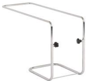
Table de lit

CHF 30.- par mois CHF 1.- par jour Taxe de base CHF 15.- Achat CHF 229.60